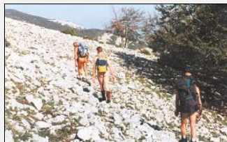
Nacktwandern im Sommer gibt es schon lange. Neu wandern sie auch bei Schnee und Kälte.