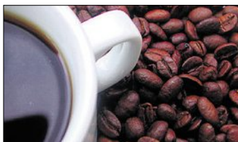
Robusta enthält 40 bis 50 Prozent mehr Coffein als Arabica.

«Neueste wissenschaftliche Erkenntnisse zeigen, dass mässiger