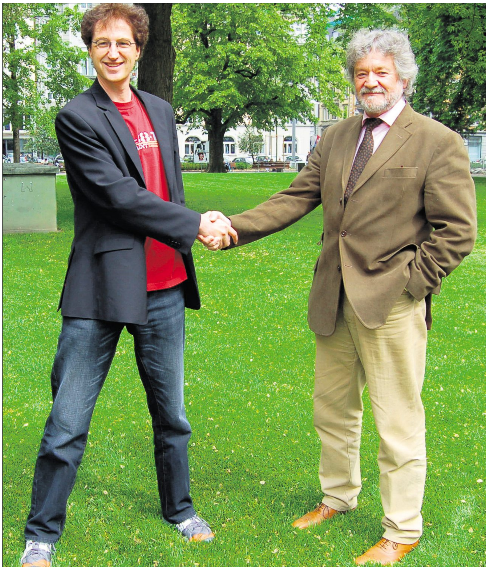
Rund zwei Jahre lang verhandelten die sechs Sozialpartner im Gastgewerbe einen neuen Landes-Gesamtarbeitsvertrag (L-GAV). Mit dem Ergebnis sind sowohl die Arbeitnehmerverbände als auch die Arbeitgeberverbände hochzufrieden.

Diese Angst ist unberechtigt. Wer sich nur billig verpflegen will, wählt heute zwischen Betty Bossy, Anna's Best, Pizzakurier und Kebab-Stand aus. Wer aber essen gehen will, der ist anspruchsvoll und erwartet eine gute Qualität und einen professionellen Service. Diese qualifizierten Mitarbeiterinnen und Mitarbeiter schaffen wir mit dem neuen L-GAV. Und diese sind produktiv genug, um die Löhne erwirtschaften zu können.